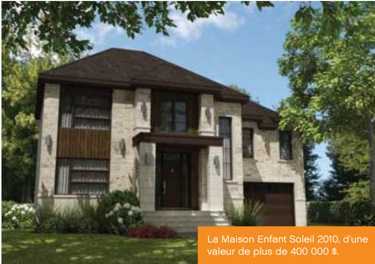
La Maison Enfant Soleil 2010, d'une valeur de plus de 400 000 $.