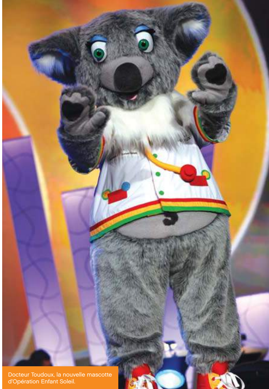
Docteur Toudoux, la nouvelle mascotte d'Opération Enfant Soleil.

Le 6 juin 2010, lors du Téléthon Opération Enfant Soleil, Docteur Toudoux a fait sa première apparition. Pour l'occasion, Arthur l'Aventurier lui a écrit une chanson qu'il a interprétée en compagnie d'une vingtaine d'enfants.