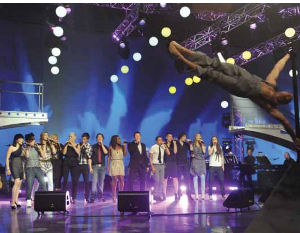
En direct du pavillon de la Jeunesse sur le site d'Exposité à Québec, les 30 et 31 mai 2009.