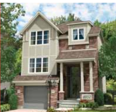
La Maison Enfant Soleil 2009, d'une valeur de plus de 400 000 $.

Ce projet a été réalisé grâce à l'engagement soutenu et à la générosité de TD Canada Trust, de la Ville de Laval, de Grilli Samuel Consortium Immobilier, constructeur officiel, de Sears, fournisseur de meubles et décorateur officiel, et de BMR Le Groupe, fournisseur principal des matériaux de construction. De plus, une initiative d'une telle envergure n'aurait pu se concrétiser sans l'appui des partenaires constituant le réseau de vente des billets : RE/MAX, Sears, BMR Le Groupe, Familiprix, TD Canada Trust et La compagnie d'assurance Missisquoi.