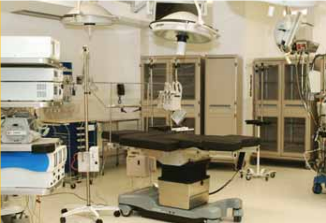
La salle de chirurgie cardiaque pédiatrique du Centre mère-enfant du CHUQ

Entièrement financée par Opération Enfant Soleil, cette salle est adaptée aux besoins spécifiques de la clientèle pédiatrique atteinte d'anomalies cardiaques. Elle évite le transfert des enfants vers un autre établissement et permet ainsi une plus grande rapidité d'intervention.